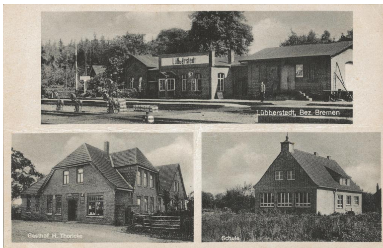
Postkarte (vor 1953)

niederzulassen, so daß die Auswanderung stark zurückgeht. Infolge der Vertreibungen des Zweiten Weltkrieges gibt es eine extreme Zuwanderung, während 1939 327 Menschen hier leben, sind es 1946 dann 607. Seit dem Jahr 2000 hält sich die Einwohnerzahl bei ungefähr 740.