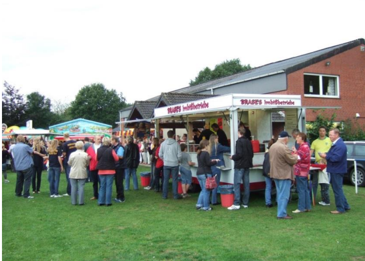
Festplatz am Dorfgemeinschaftshaus (2010)

Im Zuge der Niedersächsischen Gebietsreform, beschließt die Gemeinde Lübberstedt 1974 die Zugehörigkeit zum Landkreis Osterholz und zusammen mit den Gemeinden Hambergen, Axstedt, Holste und Vollersode zur Samtgemeinde Hambergen .