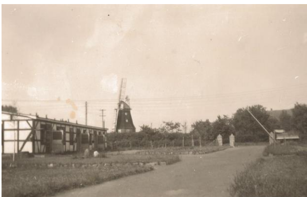
RAD-Lager an der Mühle

1924 wird der MTV Lübbestedt gegründet. Mit elf Sparten und 470 Mitgliedern ist er heute der größte Verein in Lübbestedt.