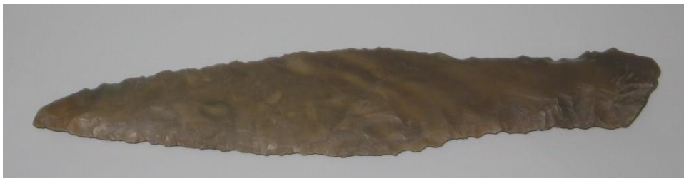
Der in der Rienhorst gefundene Feuersteindolch (ausgestellt im Historischen Museum in Bremerhaven)

Die ersten menschlichen Spuren in Lübberstedt sind etwa 12.000 Jahre alt, es sind Rentierjäger, die auf ihren Jagdzügen durch unsere Gegend kommen und hier ihre Lager aufschlagen. Erste dauerhafte Ansiedelungen gibt es ab der Jungsteinzeit.